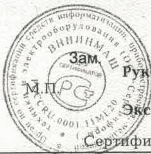
Схема сертификации - За